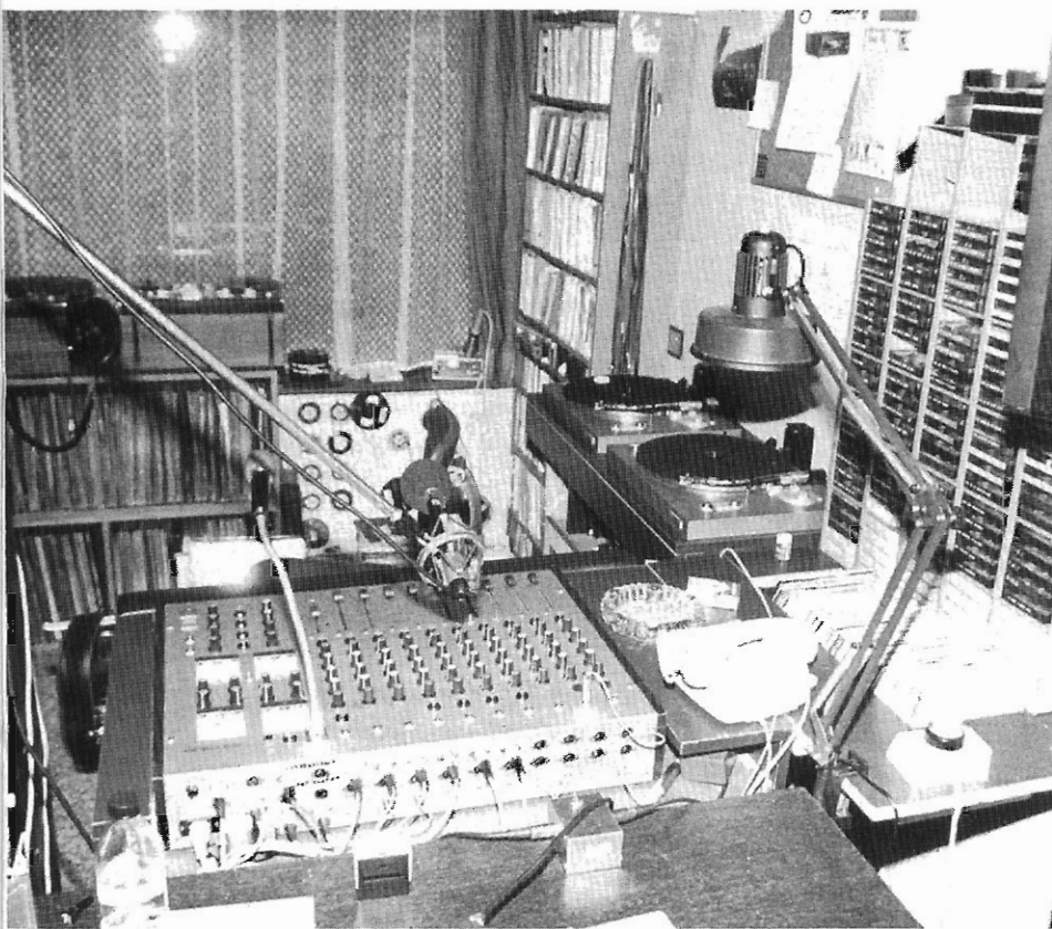
De vroegere studio's van Hofstad.

"In 1981 heeft de VARA een wedstrijd georganiseerd 'Het Beste van de Piraten'. Hofstad Radio heeft daar aan meegedaan en de tweede prijs gewonnen.